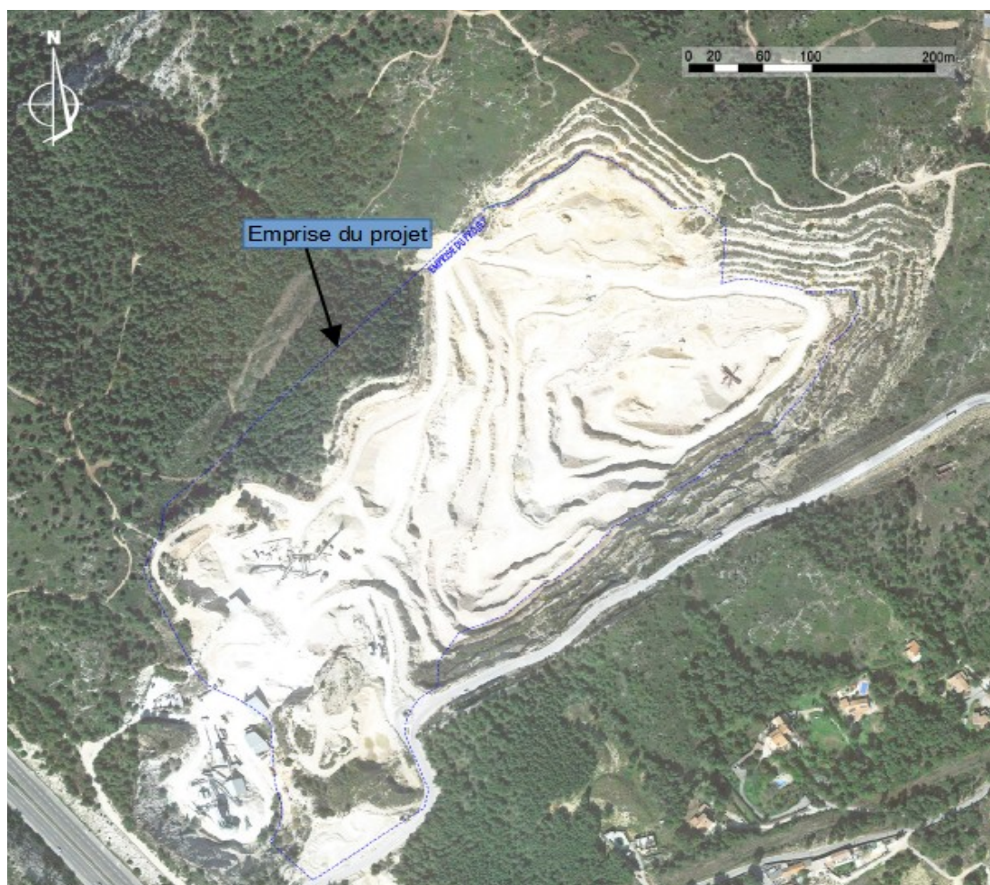
Figure 2: Emprise du projet (source : volume III - études techniques)

Selon le dossier, le tonnage global restant à extraire à fin 2018 était estimé à 16 millions de tonnes sur la superficie encore concernée par l'extraction.