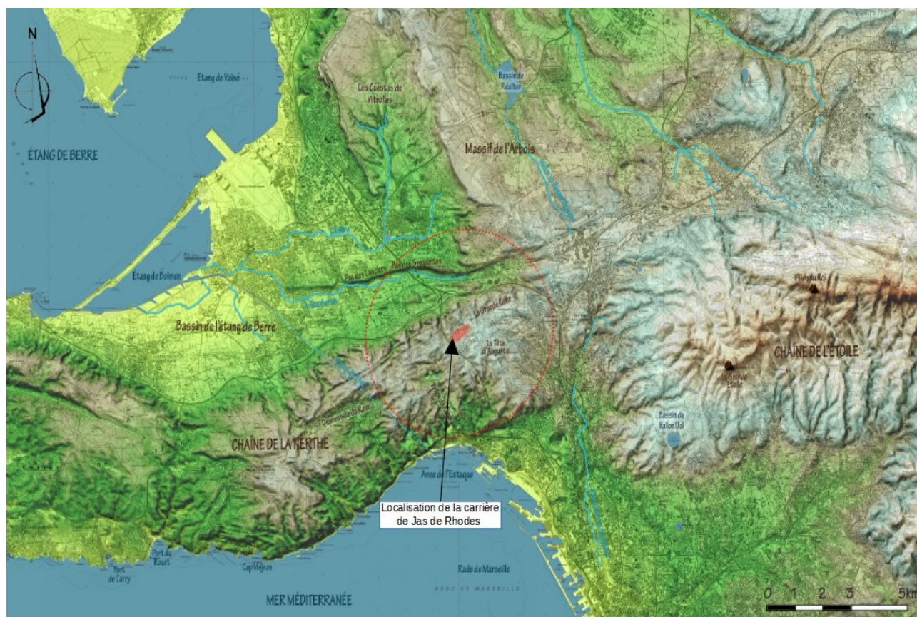
Figure 1: Plan de situation (source : Etude d'impact)

Le site, exploité depuis le début des années 1960, a fait l'objet d'un arrêté préfectoral d'autorisation le 26 juin 1996, pour une durée de 26 ans et un gisement estimé à 13 000 000 tonnes. Pour une superficie d'exploitation de 20,4 ha, la cadence maximale d'extraction est de 500 000 tonnes par an. L'exploitation est réalisée par gradins successifs jusqu'à une cote minimale de 182,5 m NGF sur les 16,2 ha encore concernés par l'extraction. La demande d'extension est incluse dans le périmètre d'autorisation de l'arrêté du 26 juin 1996.